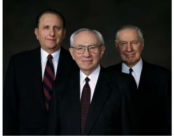
Ensimmäinen presidenttikunta: ensimmäinen neuvonantaja Thomas S. Monson, presidentti Gordon B. Hinckley ja toinen neuvonantaja James E. Faust

Jäsenistön perusyksikkö on perhe. Kirkko opettaa, että arvoja ja ihanteita voi parhaiten opettaa ja niistä voi parhaiten näyttää esimerkkiä juuri perheessä. Vanhempien velvollisuuksia tähdennetään voimakkaasti, ja kirkko nähdään tärkeänä voimavarana, joka auttaa perheenjäseniä kehittymään sosiaalisesti, emotionaalisesti, älyllisesti ja hengellisesti.