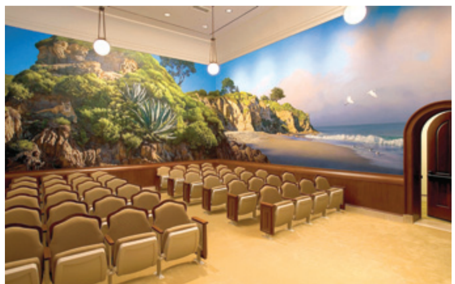
Opetushuone Newport Beachin temppelissä Kaliforniassa.

Moroni kätki maahan metallilevyt, joille Mormonin kirja alun pitäen kirjoitettiin, jotta ne säilyisivät