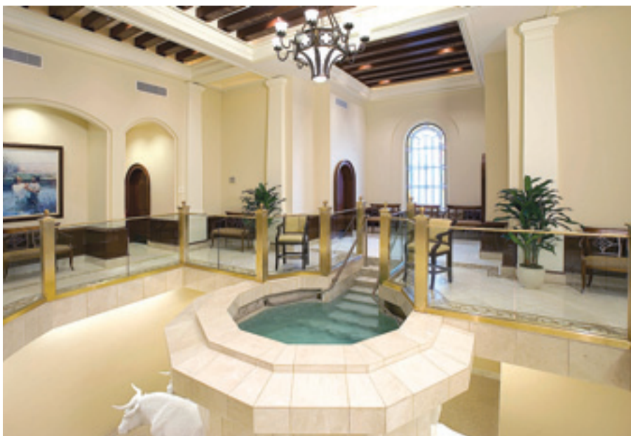
Kasteallas Newport Beachin temppelissä Kaliforniassa. Kasteallasta kannattelevat 12 härkää edustavat Israelin 12 heimoa.

pien Aikojen Pyhien Jeesuksen Kristuksen Kirkon jäseniä. Totuus onkin se, että mahdollisuus tulla temppeliin ja päästä osalliseksi sen tarjoamista siunauksista on kaikilla, jotka ottavat vastaan evankeliumin ja tulevat kastetuiksi kirkkoon.