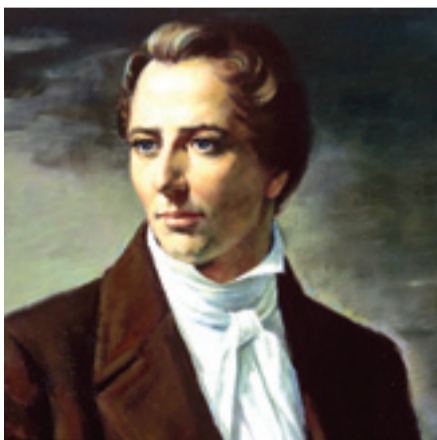
Joseph Smith (1805 – 1844)