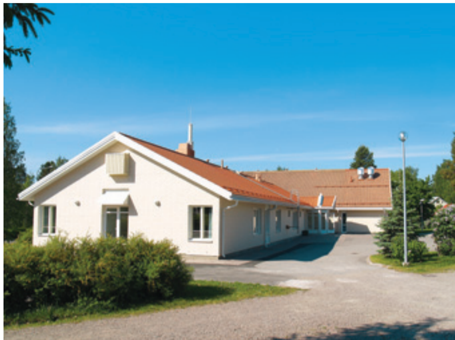
Espoon seurakuntakeskus Tuomarilassa.

Myöhempien Aikojen Pyhien Jeesuksen Kristuksen Kirkko on mikrofilmannut sukututkimustarkoituksiin Suomen evankelisluterilaisten ja ortodoksiseurakuntien kirkonkirjat vuoteen 1860 asti. Filmaustyö alkoi vuonna 1948 ja päättyi vuonna 1955. Filmit sisältävät kuvia noin 10 miljoonasta aukeamasta. Kirkko on lahjoittanut kopion kaikista filmeistä Suomen Kansallisarkistolle. Nämä samoin kuin muut kirkon mikrofilmit ovat yleisön käytettävissä