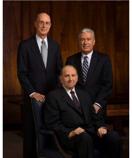
Ensimmäinen presidenttikunta: ensimmäinen neuvonantaja Henry B. Eyring, presidentti Thomas S. Monson ja toinen neuvonantaja Dieter F. Uchtdorf.

Jäsenistön perusyksikkö on perhe. Kirkko opettaa, että arvoja ja ihanteita voi parhaiten opettaa ja niistä voi parhaiten näyttää esimerkkiä juuri perheessä. Vanhempien velvollisuuksia tähdennetään voimakkaasti, ja kirkko nähdään tärkeänä voimavarana, joka auttaa perheenjäseniä kehittymään sosiaalisesti, emotionaalisesti, älyllisesti ja hengellisesti.